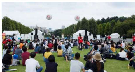
生物多様性を意識するためのイベント