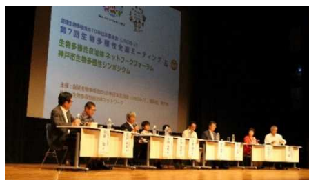
市民、企業、行政など多様な関係者が集うシンポジウム