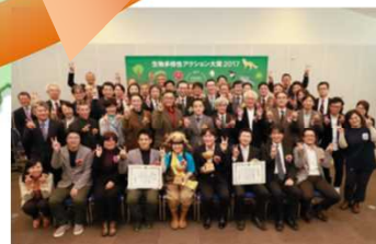
生物多様性につながる活動を表彰