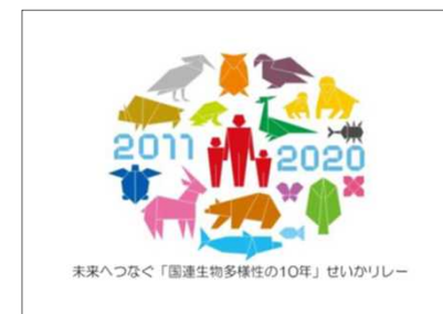
キャンペーンロゴ (イベント共通で使用)