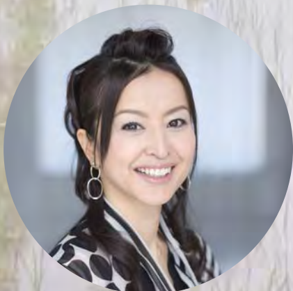
講演 大桃美代子氏 [タレント] 生物多様性リーダー・地球いきもの応援団