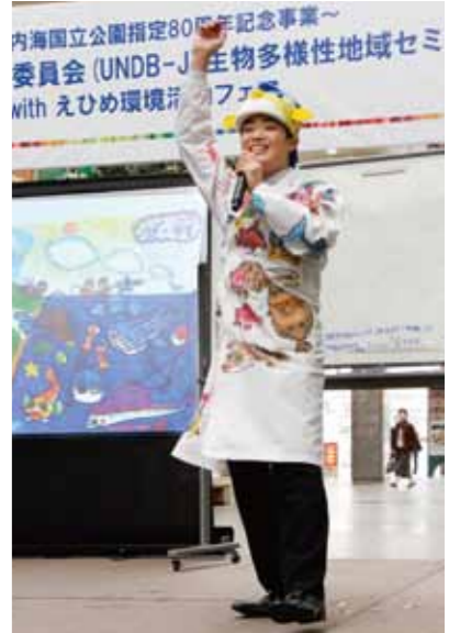
写真:UNDB-J生物多様性地域セミナーinえひめ

・日本政府 クールアースアンバサダー、環境省 国連「ESDの10年」後の環境教育推進方策懇談会有識者メンバー、「チャレンジ25キャンペーン」メンバー、文部科学省 日本ユネスコ国内委員会広報大使/ESDオフィシャルサポーター、農林水産省 お魚大使/「フード・アクション・ニッポン」メンバー、JICA(国際協力機構)「なんとかしなきゃ!プロジェクト」メンバー、WWF(世界自然保護基金)親善大使/WWFジャパン顧問、FSC(森林管理協議会)親善大使、日本魚類学会会員、JF全国漁業協同組合連合会・魚食普及委員