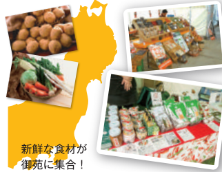
新鮮な食材が御苑に集合！

日本各地の産地から自慢の秋の味覚を集めた青空マルシェを2日間限定でオープン。野菜・青果からご当地産物まで、新鮮で美味しい食材を沢山取り揃えています！