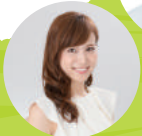
TBSアナウンサー 笹川友里