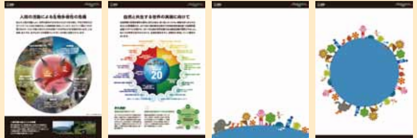
生物多様性保全の現状に関する具体的情報