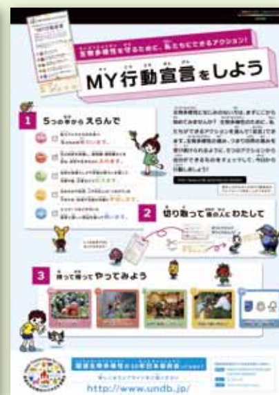
MY行動宣言シート説明ポスター