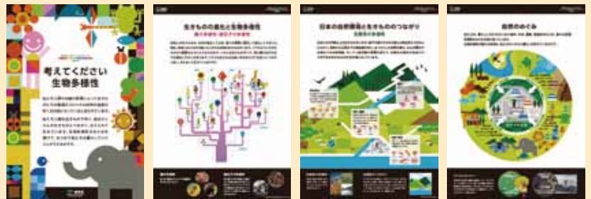
生物多様性保全の大切さを理解するための基本情報

小学校などでの展示、生物多様性の啓発につながるイベント等の実施や、事業者の生物多様性に関するCSR等の活動の際にご利用ください。