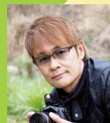
鉄崎幹人 (アウトドア派タレント)

NPO、企業、学生等による 生物多様性のブース出展 生物多様性フードコート ステージイベント など